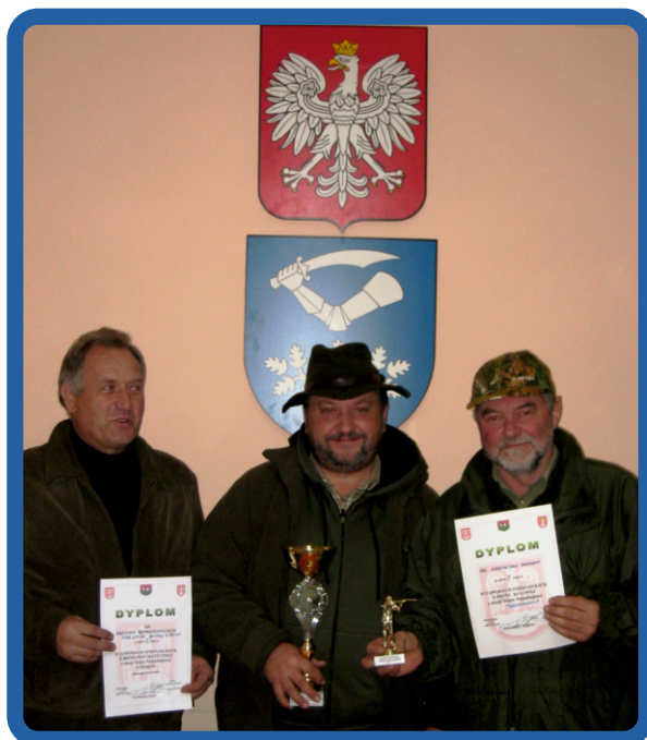
Na fot. drużyna Rady Gminy